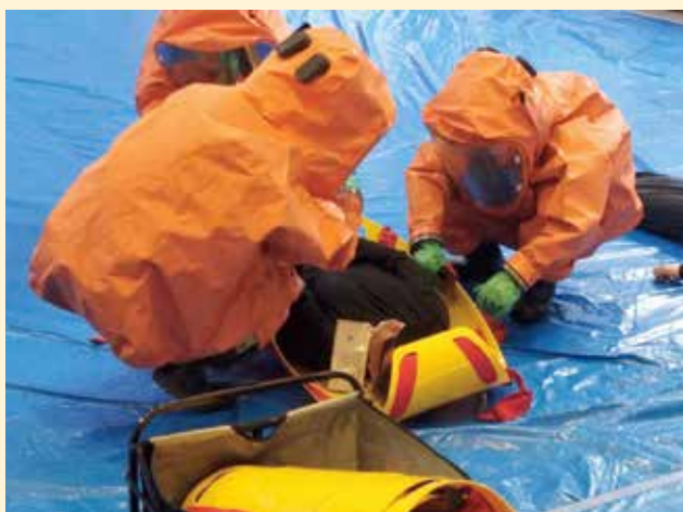
化学防護服を着用して救助する深谷市消防本部

今年度は深谷市が共催となった訓練。関係機関と協働しながら救護活動を実践する機会となりました。