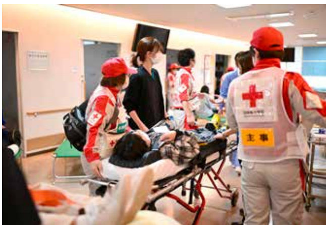
黄（中等症）エリアの様子