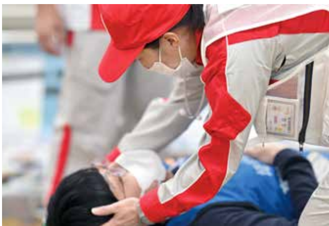
搬送された傷病者に対応する救護班

また支援の要請を受けて到着した後続班（さいたま赤十字病院・小川赤十字病院・原町赤十字病院）が各エリアの当院職員と連携して活動に入りました。