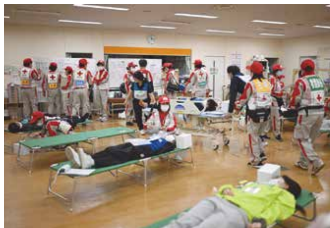
赤（重症）エリアの様子