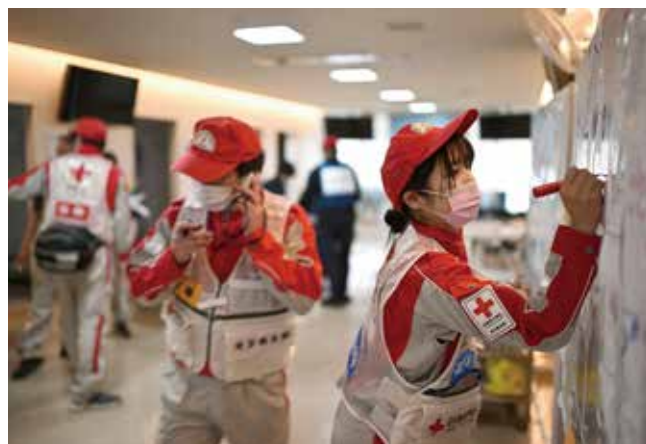
傷病者の情報を記録し、入院・転院が必要な場合は本部へ要請