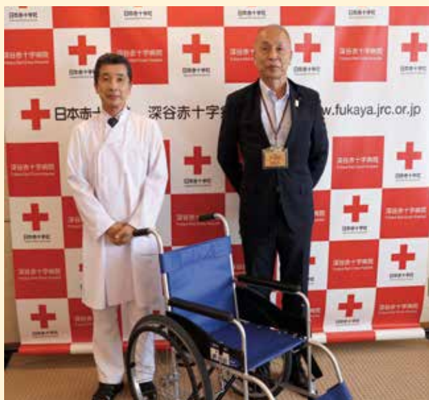
石川院長と株式会社渋沢の坂本社長