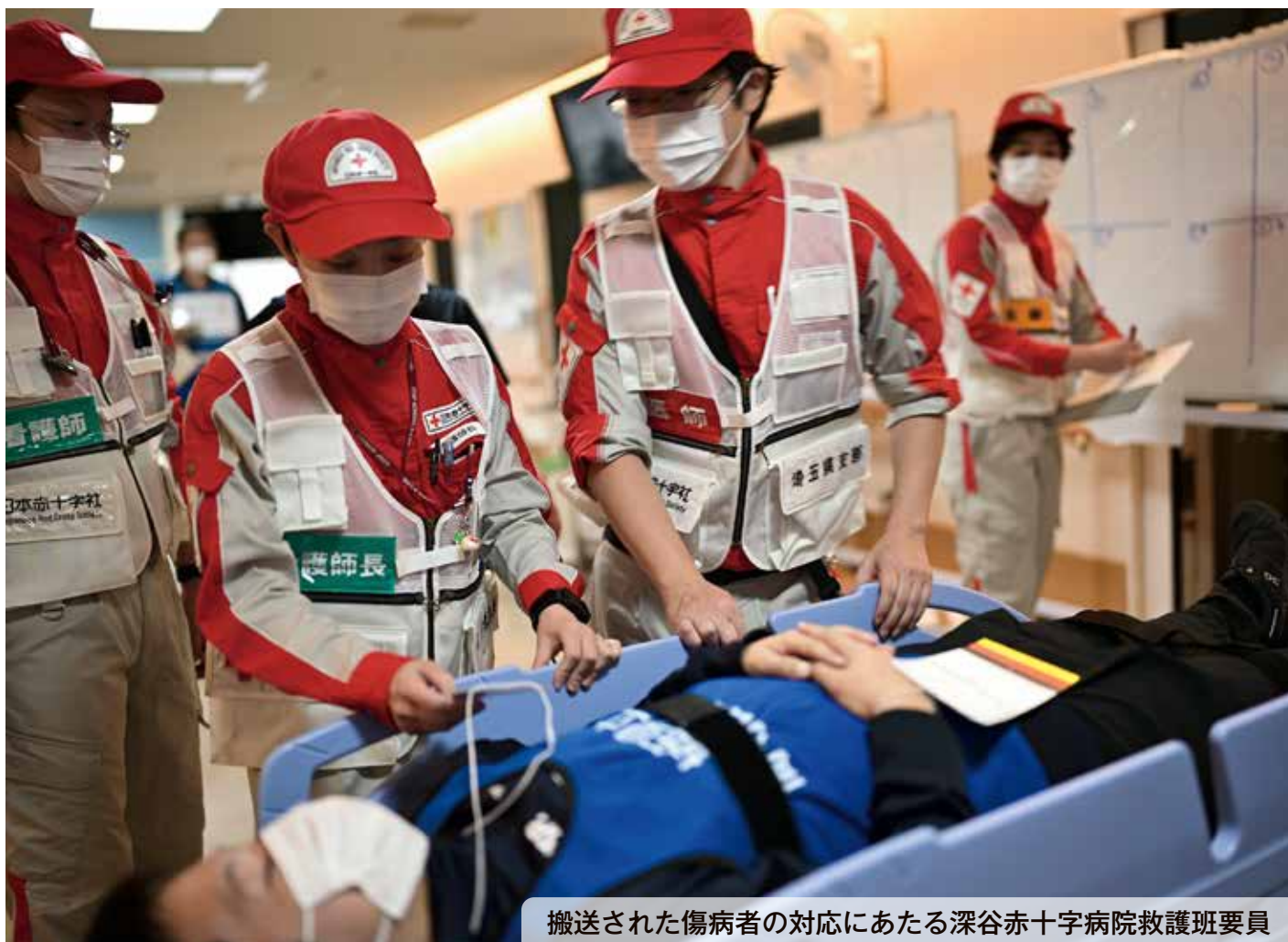
搬送された傷病者の対応にあたる深谷赤十字病院救護班要員