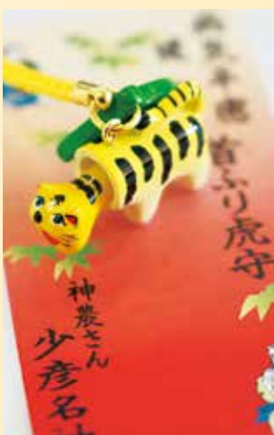
▲少彦名神社 「首ふり虎御守」 少彦名神社は昔から、日本医薬総鎮守 病氣平癒・健康成就の社として知られています。

院長室にはいくつかのお守りを飾っています。その中の一つである、昨年の丑年である「赤べこ」はなかなか難を救ってくれませんでした。今年は寅年ということで、「首ふり虎御守」という虎のお守りを飾っています。これは大阪にある「少彦名神社（すくなひこな）」のもので、ここに祀られている「少彦名命（すくなひこなのみこと）」は薬の神様で、一寸法師のモデルともいわれているそうです。今年こそは病氣平癒や健康を守るこの虎に活躍してもらいたいですね。