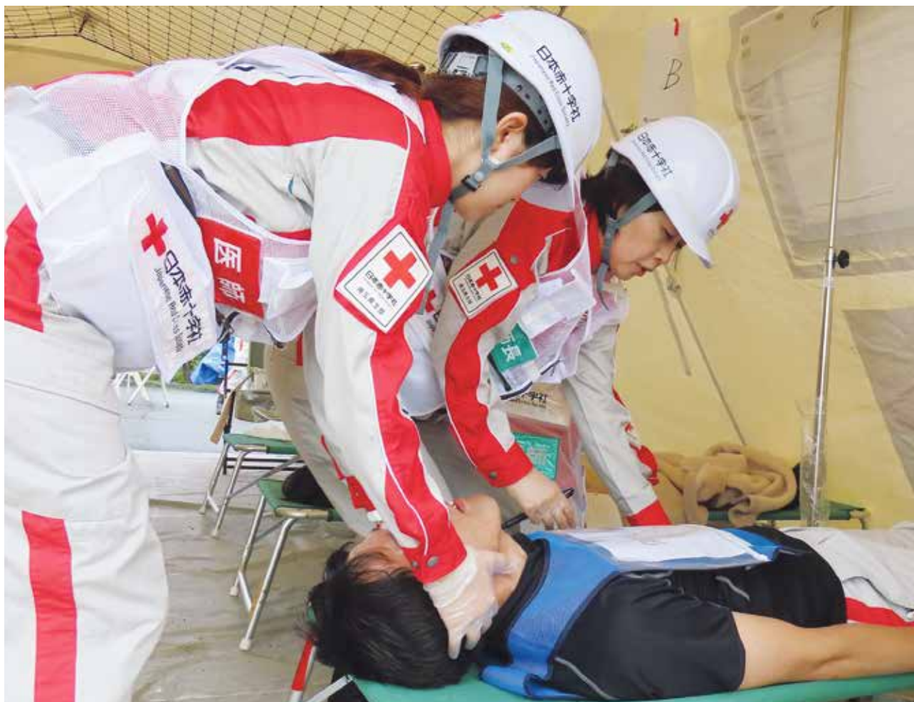
埼玉県内赤十字施設による救護訓練の様子 [令和元年 6月：秩父郡 皆野町にて]